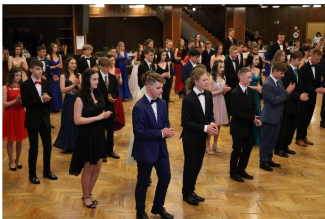
Kurz taneční výchovy