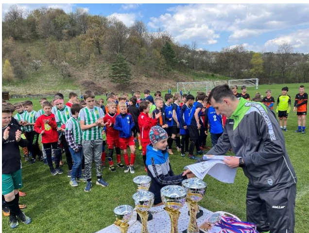
McDonald's Cup 2021/2022