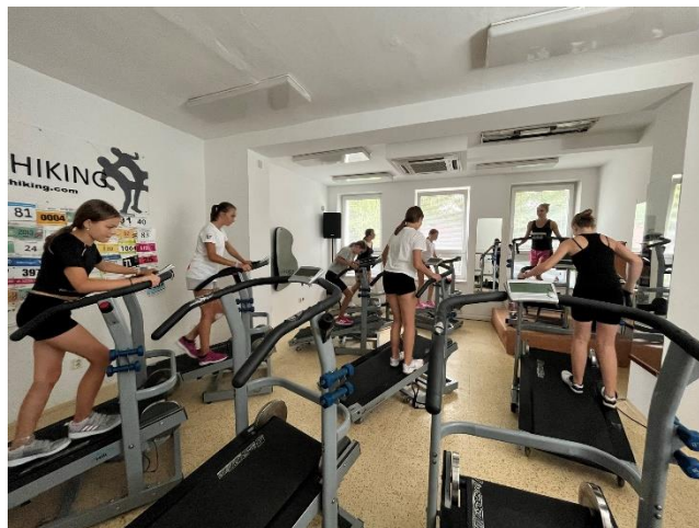
Sportovně volejbalový tábor