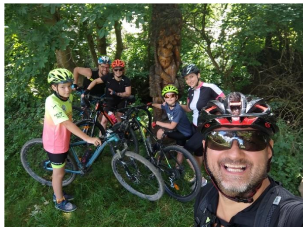
Cyklotoulky valašskou krajinou