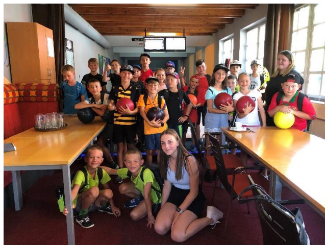
Tábor „Sportáček aneb Sportujeme pro radost“