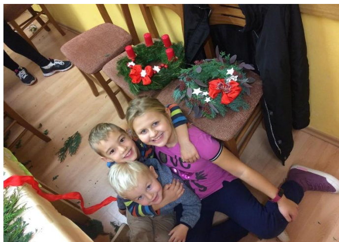
Výroba adventních věnečků