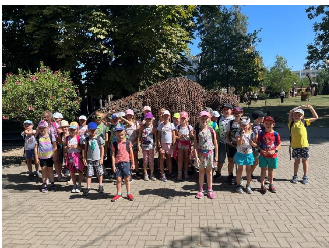
Tábor „Tlapkova patrola opět zasahuje“