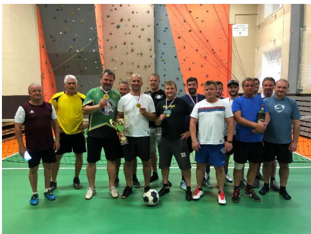
Zimní nohejbalová liga