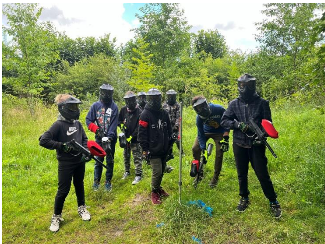
Adrenalinový tábor plný zážitků