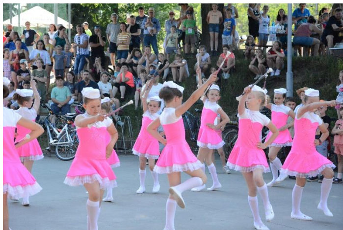
Za pohádkou na kolech – vystoupení ZŮ