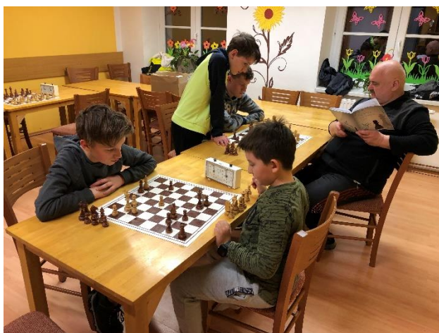
ZÚ - Šachy