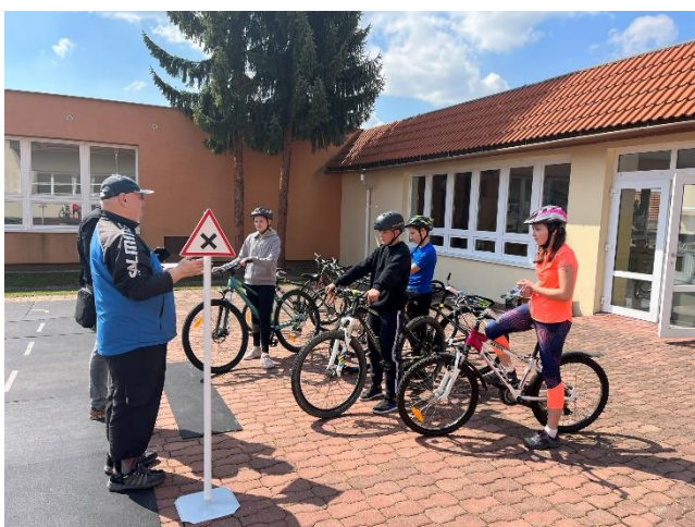
Dopravní soutěž mladých cyklistů