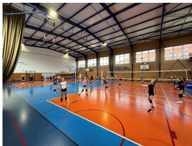
ZÚ - Odbíjená