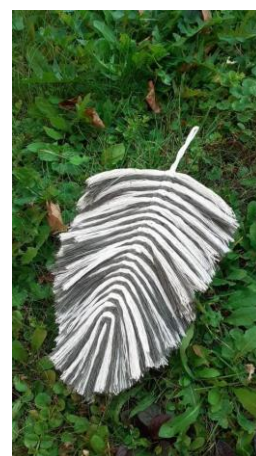
ZÚ – Kreativ