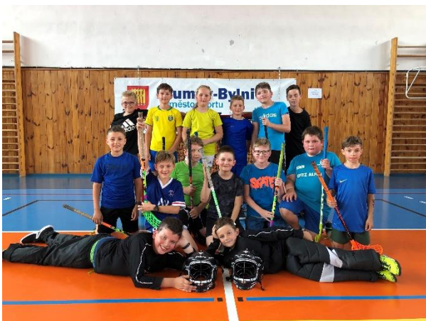
ZÚ – Florbal