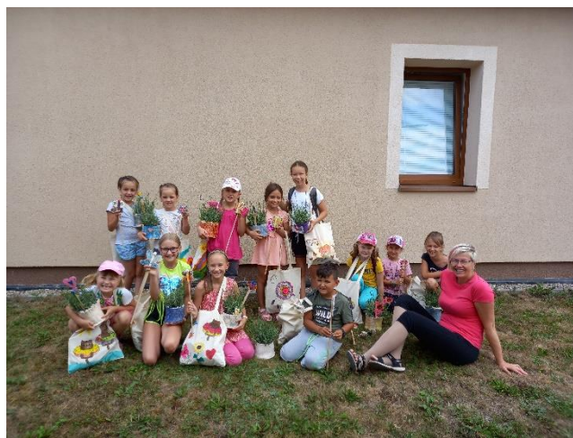
Tábor „Prázdniny s keramikou II.“