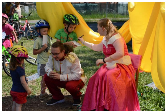
Za pohádkou na kolech – děti na cyklostezce