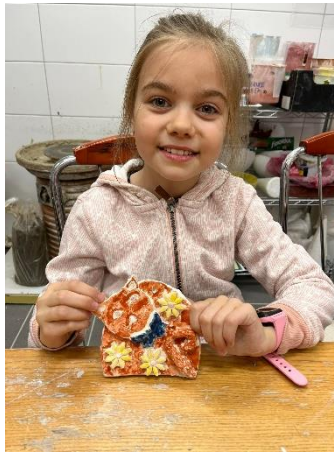
ZÚ – Keramika