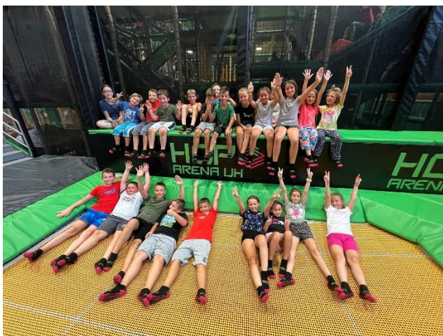
Supertábor pro superhrdiny