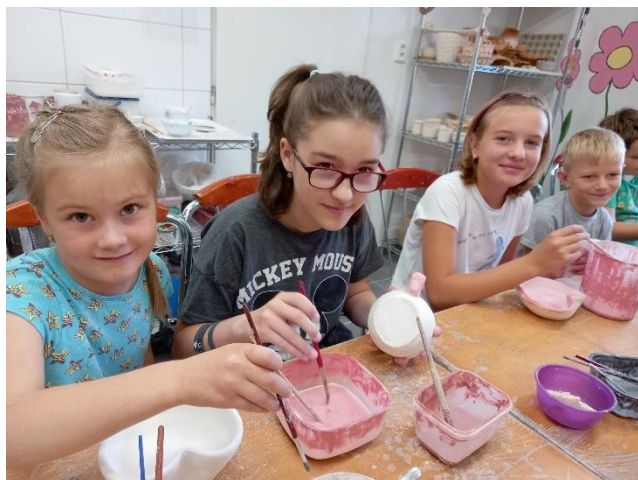
Tábor „Prázdniny s keramikou I.“